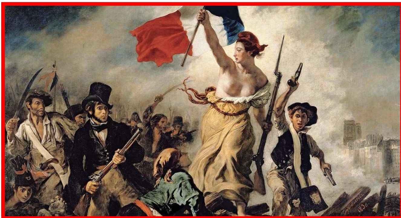
Tableau du peintre Delacroix représentant La Liberté menant le peuple