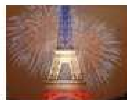
Le 14 juillet